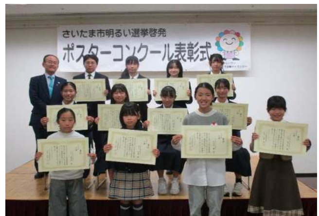
選挙啓発ポスターコンクール表彰式